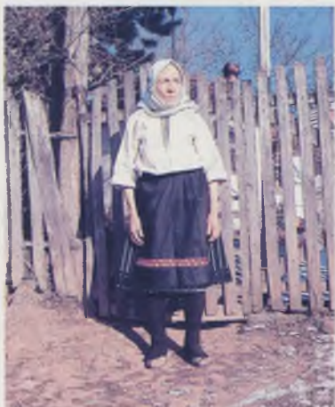
Женска ношња између првог и другог светског рата