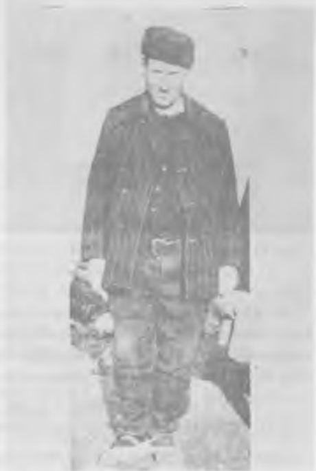
Женска и мушка ношња у сврљишком крају између два светска рата.