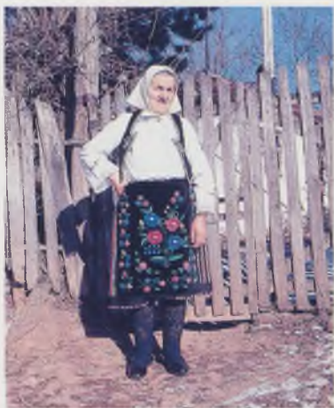
Женска ношња после првог и другог светског рата