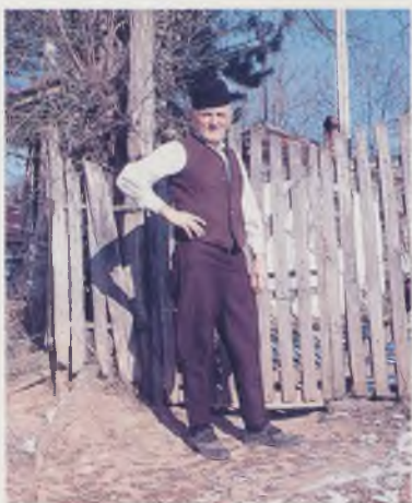
Мушка ношња после првог и другог светског рата