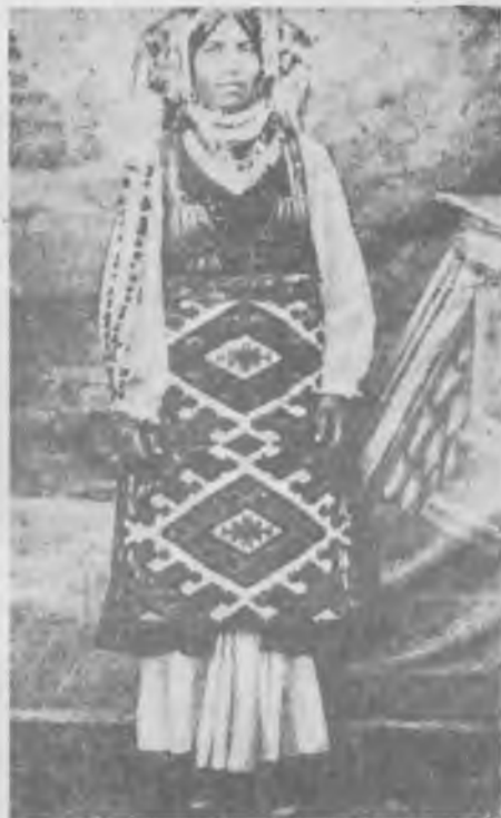
Женска старинска ношња, околина Сврљига.

Одећу су углавном кројиле и шиле жене и сеоске занатлије. Крајем 19. и почетком 20. века имућнији сељаци наручују у граду и поједине делове ношње налик на градску ношњу 19. века, нпр. срмене јелеке, либада, ципела, фес и др. У то време почиње и нагли продор шумадијске мушке ношње, нарочито у западним деловима сврљишког краја.