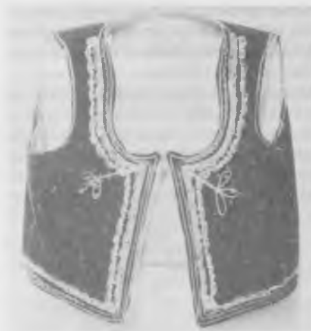
Јелек од сомота украшен срмом