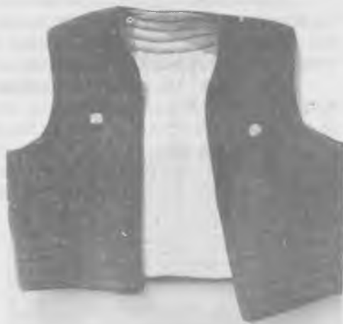
Јелек од чоје испуњен памуком и прошиван